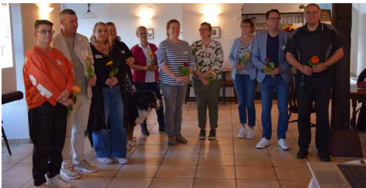
Ausstellung zur Innenentwicklung, eingereichte Fotos für den Fotowettbewerb und die Fotograf*innen